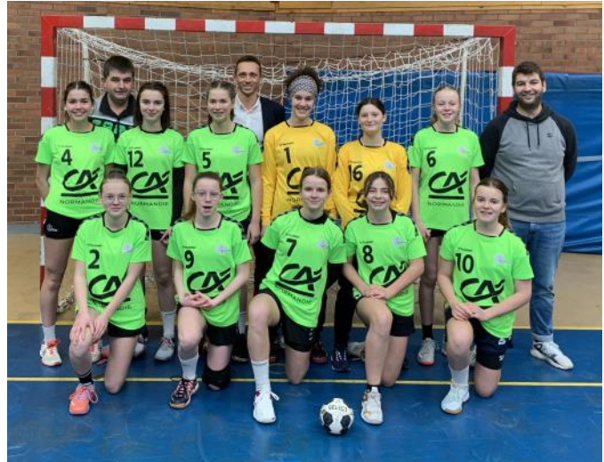
l'équipe -15ans filles1 saison 2021/2022

La fédération française de Handball a attribué au club de l'amicale Laïque de Marigny le label argent pour la saison 2019-2020 et 2020-2021.