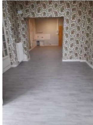
Changement de sol

Valérie BISSON présente le projet des futurs locaux de la Banque alimentaire dans l'ancien bâtiment de la Poste.