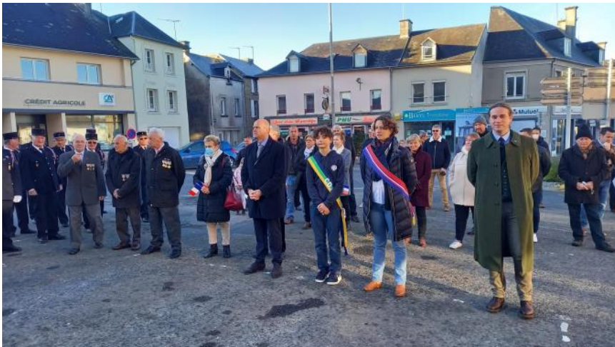
Cérémonie du 11 novembre et Journée du deuil allemand le 14 novembre en présence du directeur du cimetière allemand et des conseillers départementaux