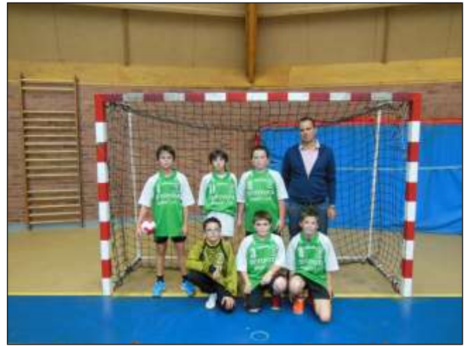
L'équipe - 13 ans garçons termine 3ème du championnat excellence départemental.