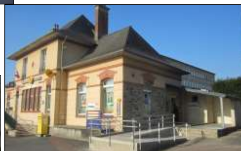
Accès à la poste.