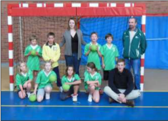
L'équipe 11ans mixte, équipe qui a disputé le championnat Honneur.