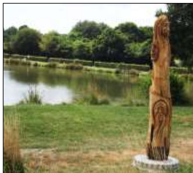
Sculpture bois à l'étang.