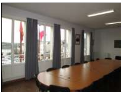
Rénovation de la salle de conseil.