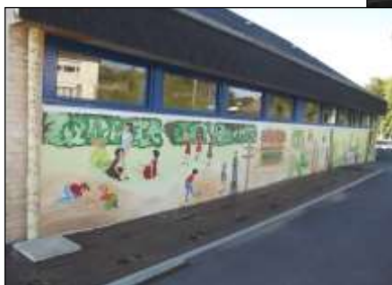
Fresque à l'école Julien Bodin.