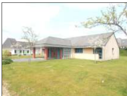
Salle du Jardin Pillard.