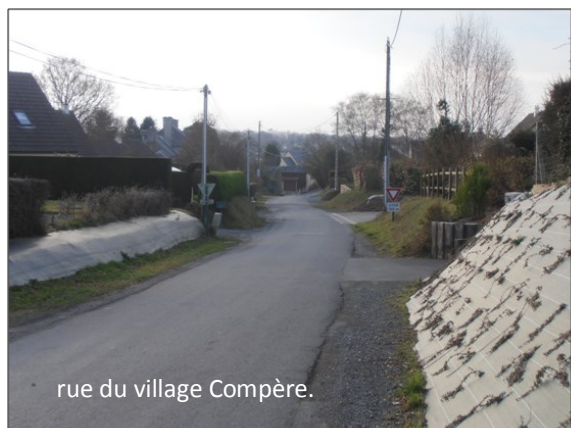
rue du village Compère.

Réfection des trottoirs rue des Sports :