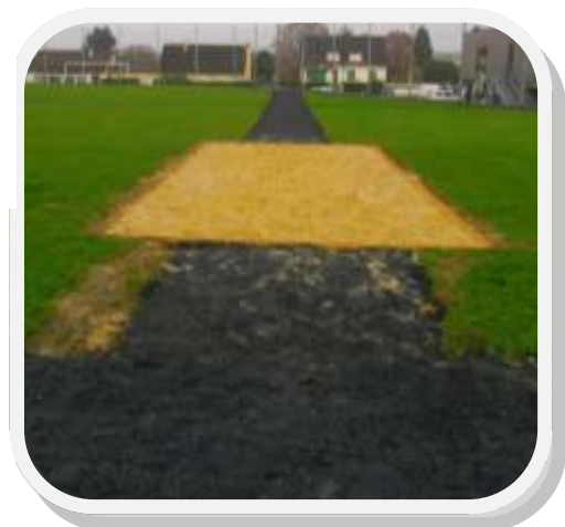
Saut en longueur