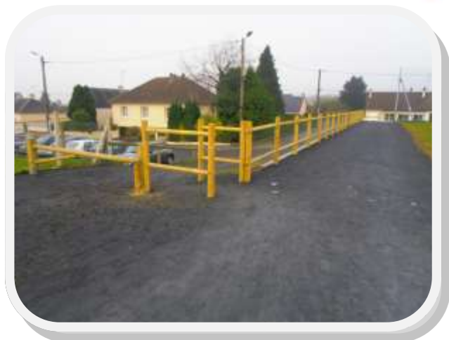
Piste de 80 mètres